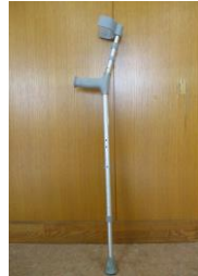
ロフストランド杖

特徴：腕を通す「カフ」という部品により、握力が弱い方でも安定しやすい。杖自体が大きく置き場所を選ぶ。