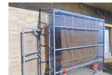
冷たい風を防ぎながら日差しを取り込みます。雨も大丈夫です。