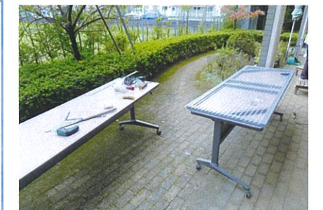
ご面会スペースの設計、施工はファインハイムの職員です。