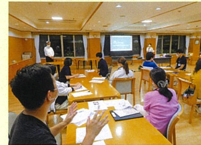
全職員で感染症対策を学んでいます。