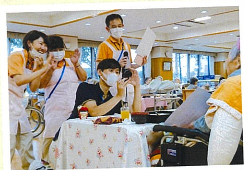
敬老表彰の記念写真「笑って、笑って〜」