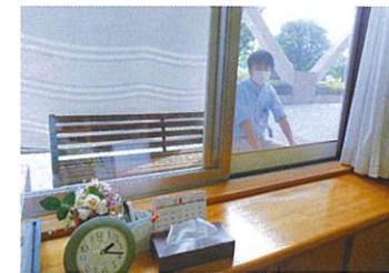
ご利用者は応接室で。ご家族はタープで日よけとプライバシーを守ります。