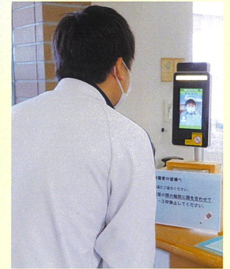
来館された方の体温を自動で測定します。