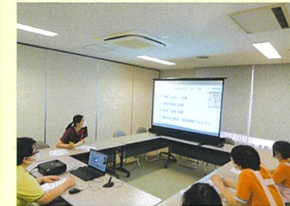
研修や会議は極力リモートで行います。