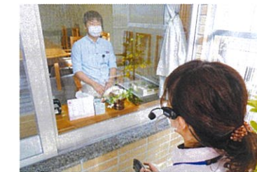
耳掛けマイクとスピーカーでよく聞こえます。