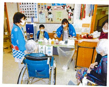
どの味にしようかな?