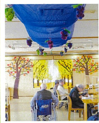
ご利用者と一緒に天井や壁を装飾しました(通所)