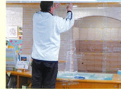
アクリルカーテンを随所に設置しました。