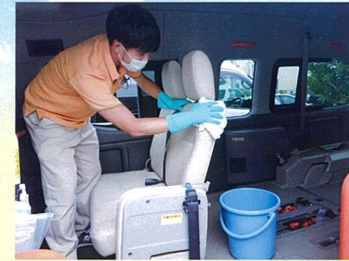
除菌も頻繁に、入念に行います。