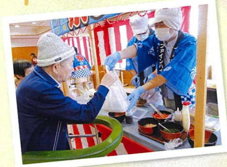
祭りの味といえば、焼きそば